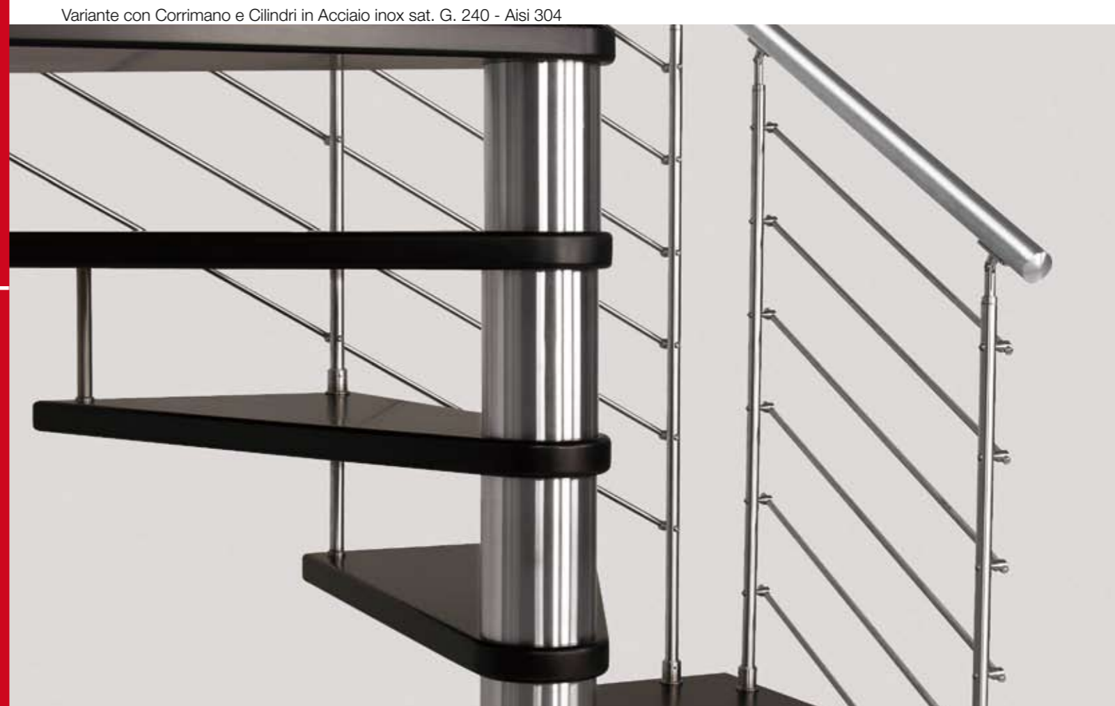
Variante con Corrimano e Cilindri in Acciaio inox sat. G. 240 - Aisi 304