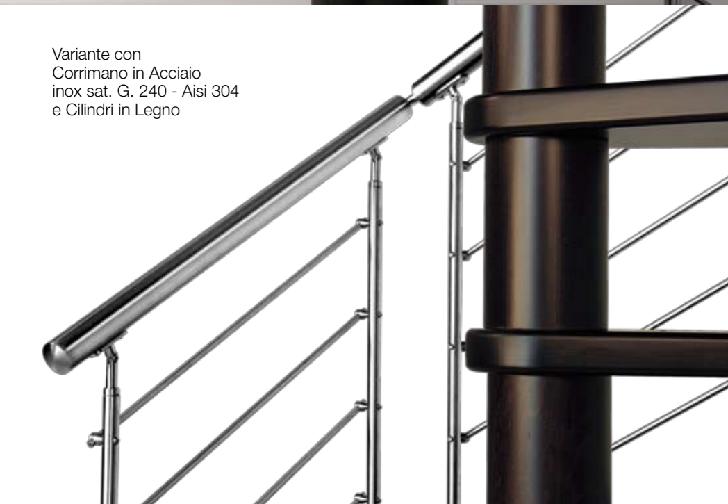
Variante con Corrimano in Acciaio inox sat. G. 240 - Aisi 304 e Cilindri in Legno