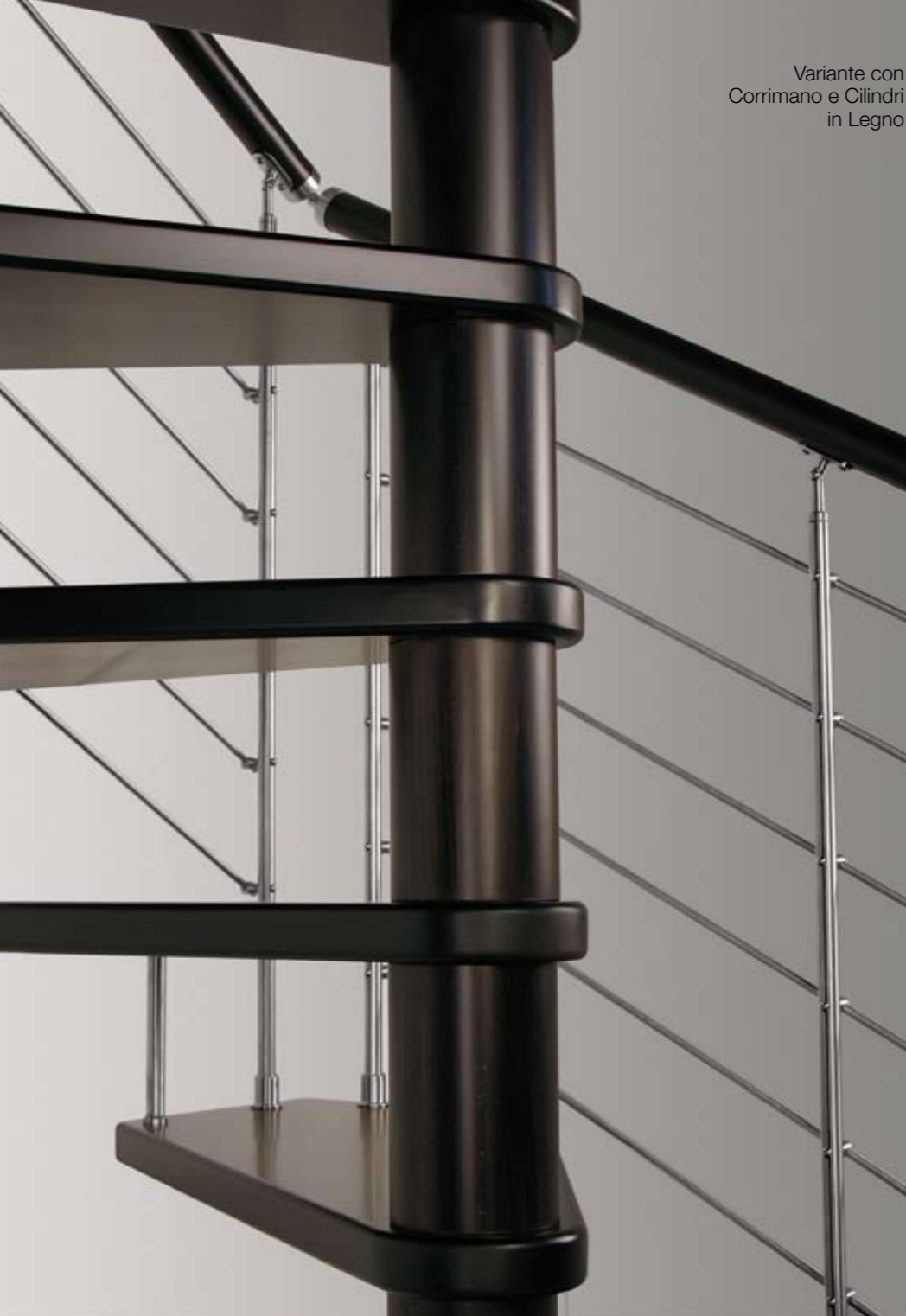
Variante con Corrimano e Cilindri in Legno