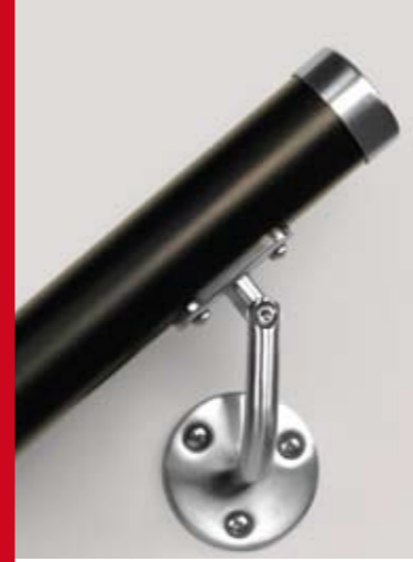
Supporto corrimano a muro