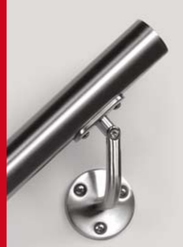
Supporto corrimano a muro

Scala realizzata in Faggio Lamellare 350.