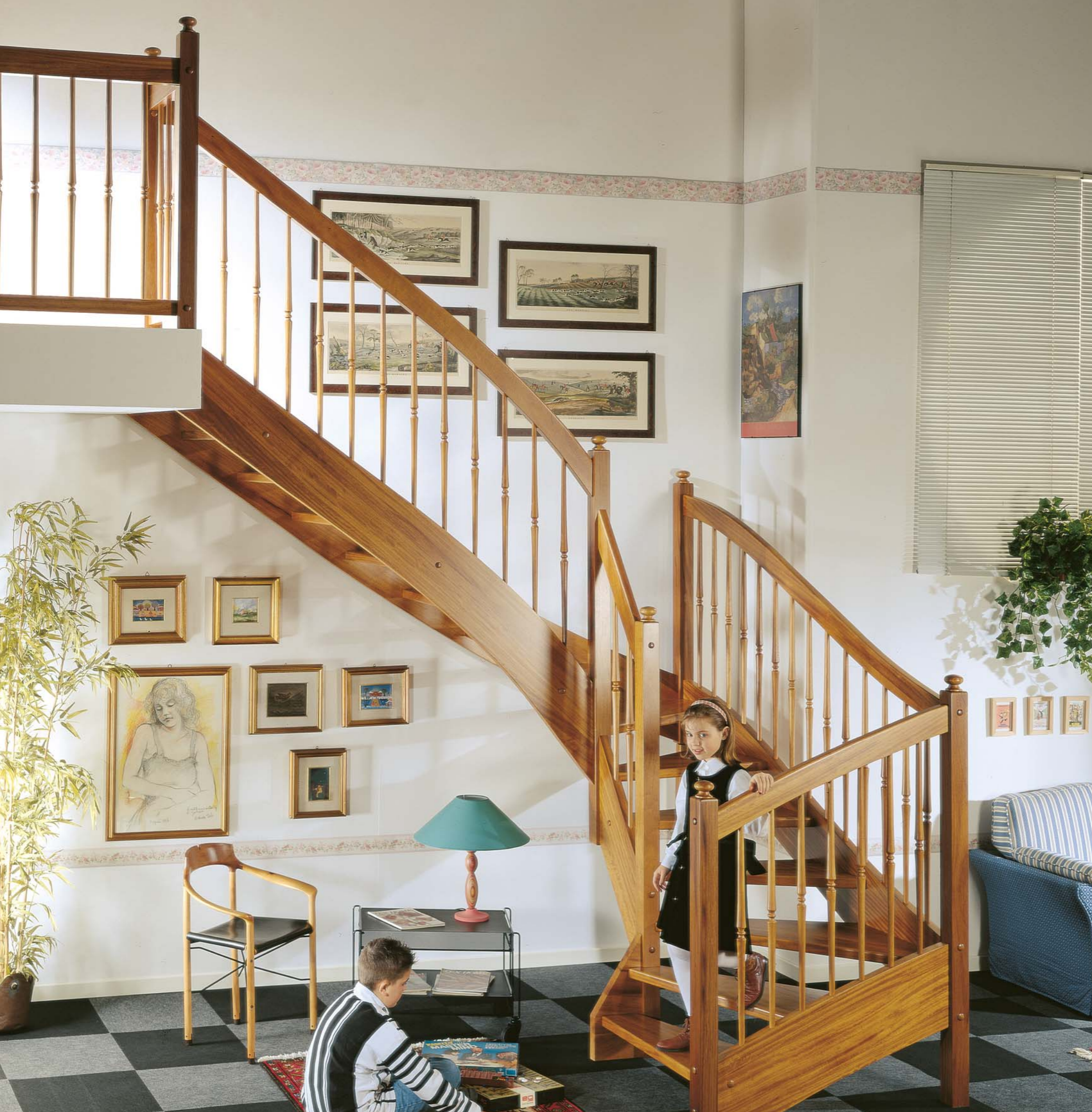
Scala realizzata in Iroko massello 620. Ringhiera 2° lato, prima e seconda rampa. Balastra di protezione.